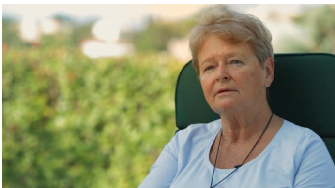
Gro Brundtland - Ex-

Primeira Ministra da Noruega e Diretora Geral da Organização Mundial da Saúde