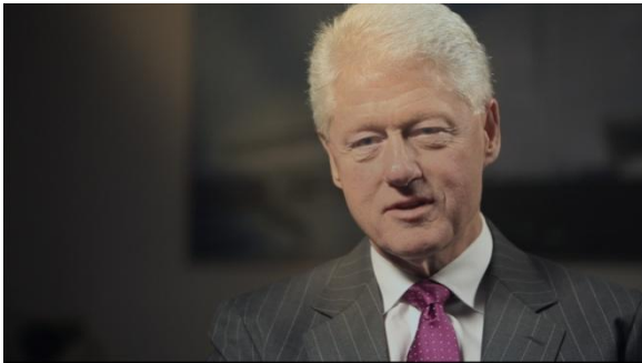
Bill Clinton, Presidente dos Estados Unidos (1993 - 2001)

"Só quem é burro que não muda de opinião diante de fatos novos. Eu não tinha consciência da gravidade e do que significava essa questão, naquela época como tenho hoje."