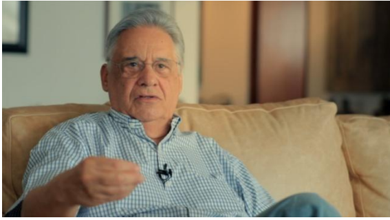
Fernando Henrique Cardoso, Sociólogo, Presidente do Brasil 1995 – 2002

"Só quem é burro que não muda de opinião diante de fatos novos. Eu não tinha consciência da gravidade e do que significava essa questão, naquela época como tenho hoje."