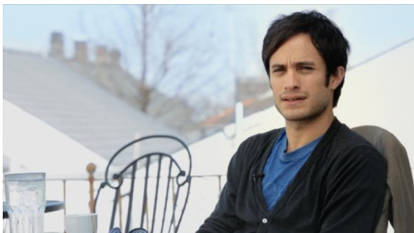
Gael Garcia Bernal , ator mexicano

"Seja aberto, seja honesto. Diga isso: É realmente a droga é fantástica você vai gostar. Mas cuidado. Por que você não vai decidir mais nada. Basta isso. Basta isso."