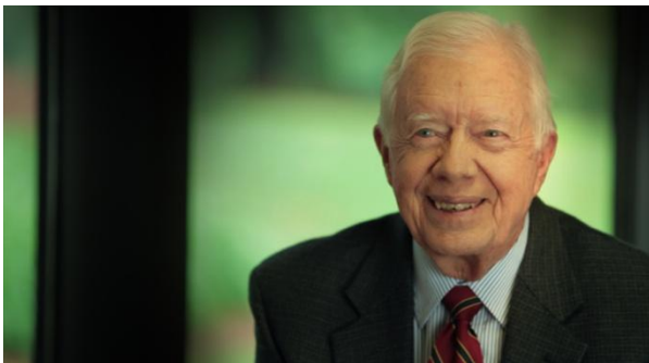
Jimmy Carter - Presidente dos Estados Unidos (1977 - 1980)

"Pensar nela como uma guerra da sociedade é um pouco enganoso, como se houvesse alguma solução militar. E sabe que tenho experiência com isso, experiência pessoal. Tive um irmão que era viciado em cocaína, então conheço muito sobre isso."