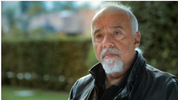
Paulo Coelho , escritor

"Quem são os dependentes? Nossas crianças... Pessoas que amamos, pessoas que realmente queremos reabilitar."