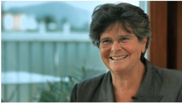
Ruth Dreifuss , Presidente da Suíça (1999)

"Quem são os dependentes? Nossas crianças... Pessoas que amamos, pessoas que realmente queremos reabilitar."